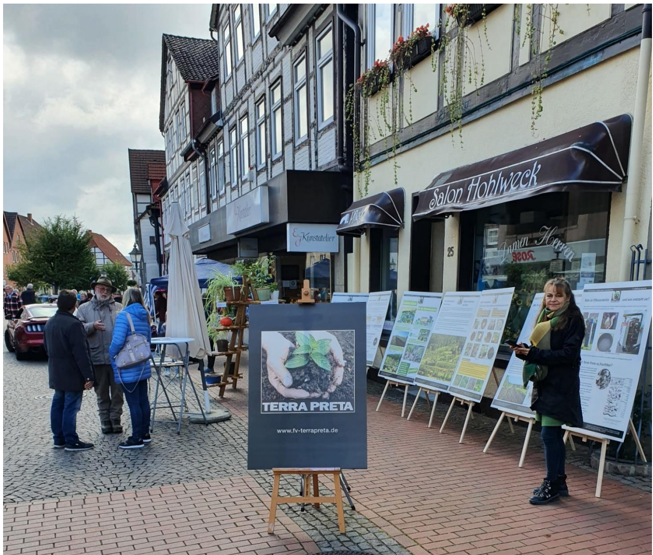
Beim Herbstmarkt in Bad Münster am 25.9.2022 bestand reger Bedarf, sich an unserem Infostand zum Thema „Terra Preta“ zu informieren.