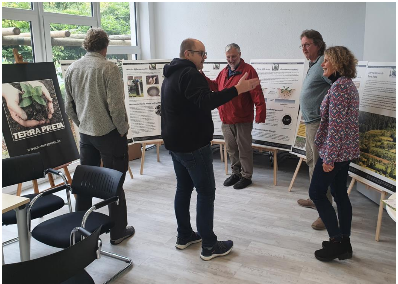
Unser Terra Preta Messestand bei den Umwelttagen von Radio Aktiv. Hier sind wir in Diskussion mit den anderen Ausstellern von Unverpackt-Laden, Naturpark Weserbergland und Schutzgemeinschaft Deutscher Wald.

Die 20.000 t Terra Preta sollen aus dem Grünschnitt des Landkreises hergestellt und zum Selbstkostenpreis an Bauern und Bürger abgegeben werden – eine nicht versiegender, ständig zur Verfügung stehende regionale Düngerquelle , die immer sprudelt und die nicht auf Stickstoff aus russischem Erdgas angewiesen ist, darauf wiesen wir bei den Umwelttagen bei Radio Aktiv hin.